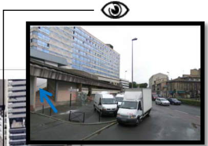
Escaliers d'accès aux terrasses (rue Georges Bonnac)