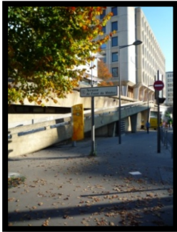
Rampe d'accès piétons (angle rue Chaufour et rue Claude Bonnier)