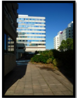
Tour de Sèze (tout au fond des terrasses)