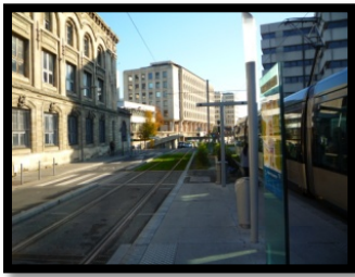
Arrêt Tram A St Bruno (Hôtel de Région)